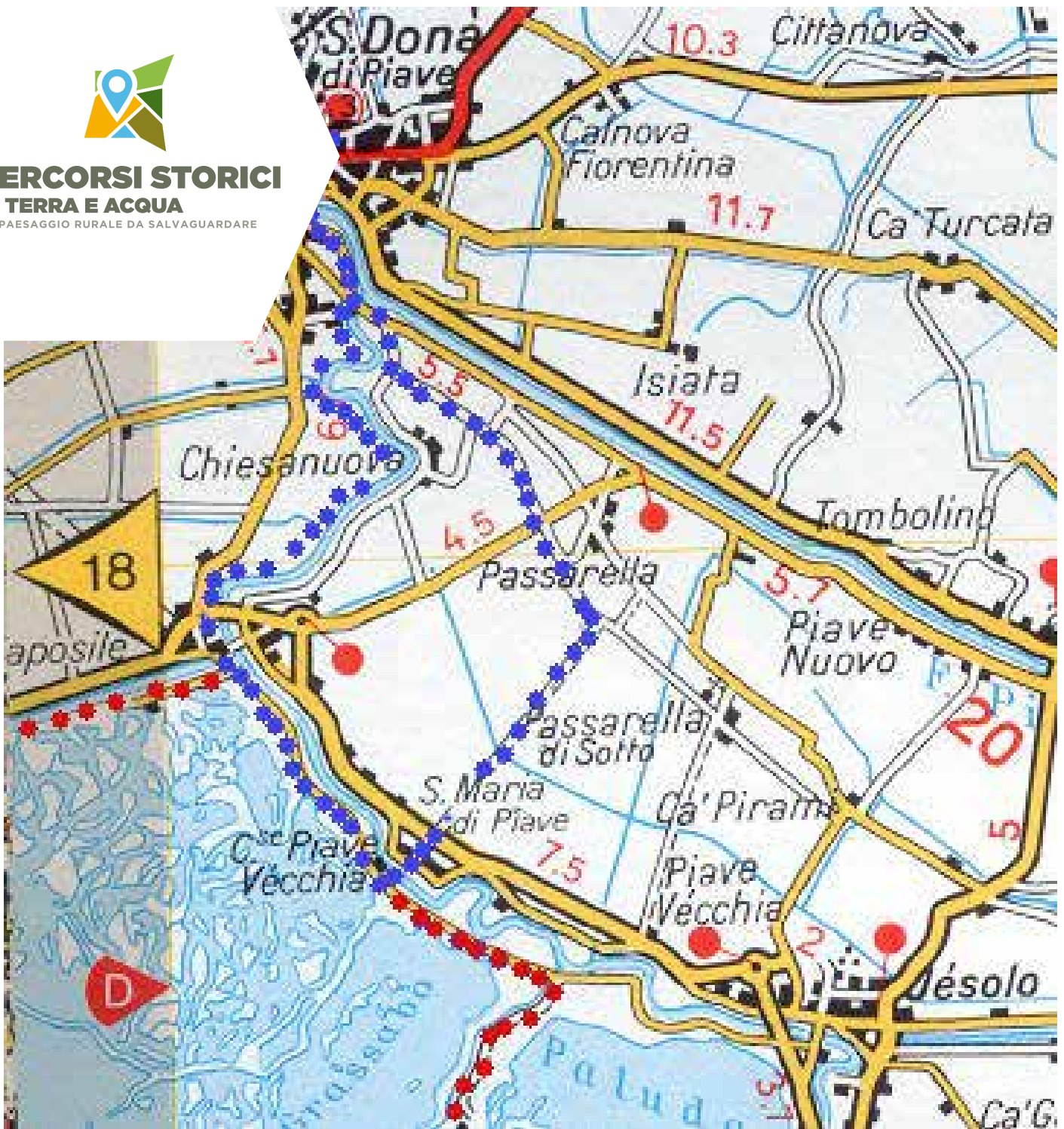
La mappa è tratta dall'Atlante Stradale d'Italia del Touring Club Italiano (scala 1:200.000). I puntini blu contrassegnano il percorso principale mentre i puntini rossi indicano le possibili deviazioni.